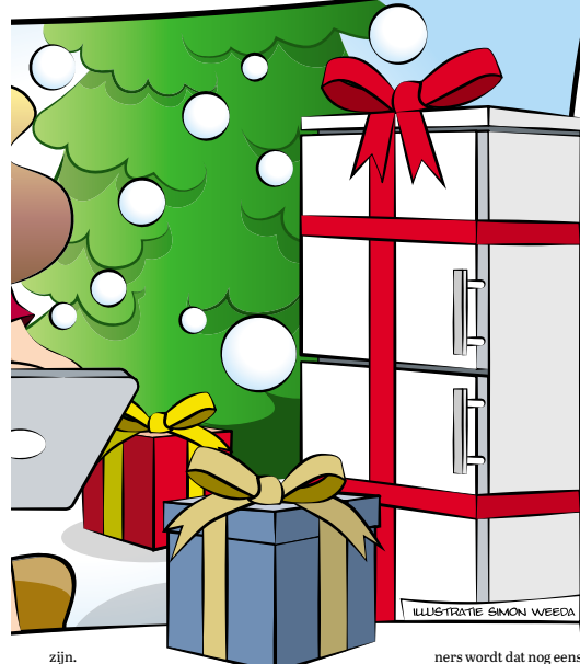
ILLUSTRATIE SIMON WEEDEA

zijn. Wie pas in de toekomst geld aan de kinderen wil achterlaten, kan ook een papieren schenking doen. Hiermee hoeven kinderen in de toekomst minder erfbelasting te betalen, zegt Overduin. 'Je doet hierbij een schenking aan een kind, maar die leent het bedrag in te feite direct weer aan jou terug. In feite blijft je als ouder gewoon over het geld beschikken.'